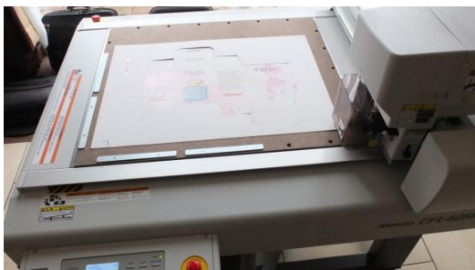
Ploter tnący CFL-605 RT Opakowanie na żądanie